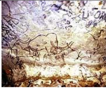
Grottes de Rouffignac